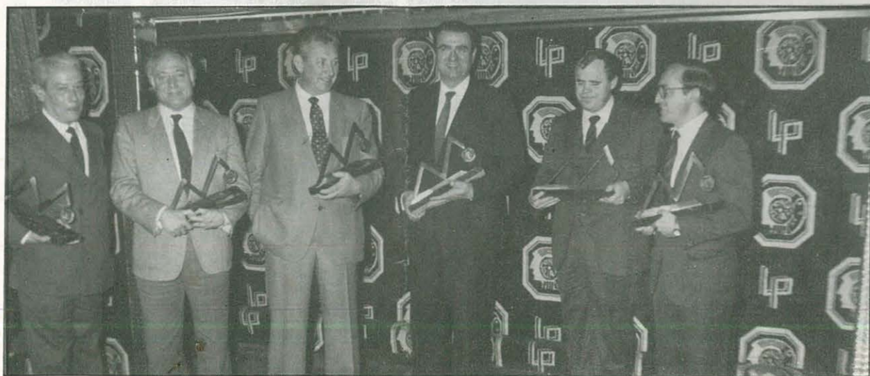
Los homenajeados con el Máster de Oro

El acto se celebró en la sede del Fórum de Alta Dirección de Madrid, resultando brillantísimo y muy completo.