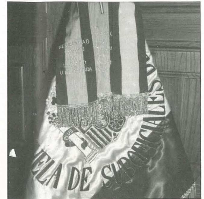
Estandarte que la Hermandad del Montsiá - Virgen de Loreto entregó a la Escuela de Sub-oficiales de la Base Aérea de Reus

«— La existencia de ambas Asociaciones— concluyó el Coronel— la conocí en llegar a la Base que tuve noticias de ello. Me encantó ver que hay un entusiasmo entre señores que han prestado el servicio militar y que siguen recordándole con cariño. Es digno