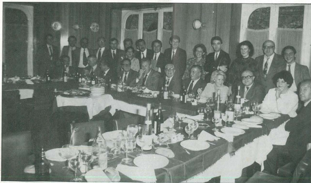
Un tramvia anomenat desig